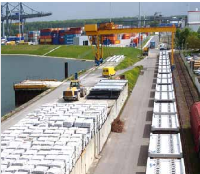
Verladung bei Stelcon, Germersheim