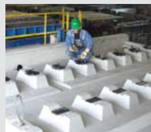
Produktionsablauf der Fertigteile