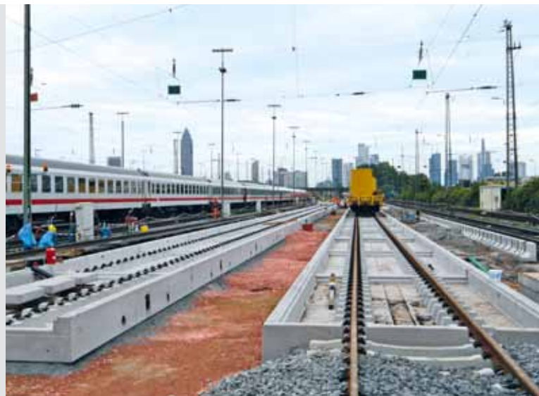
Einbau der Elemente auf Splittbett und Hydraulisch Gebundener Tragschicht (HGT)